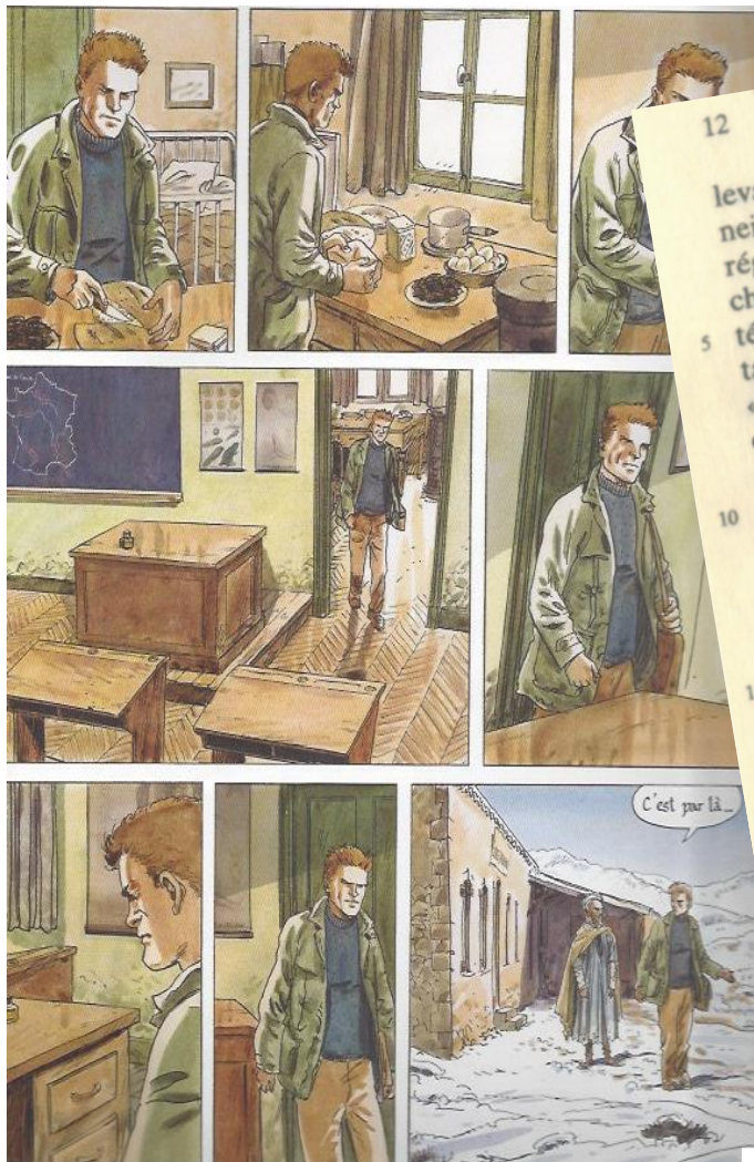
aus: L'Hôte , Jacques Ferrandez d'après l'oeuvre d'Albert Camus Klett-Verlag, 2009

12 L'Hôte levait décidément, la lumière s'élargissait sur le plateau neigeux. Quand toute la neige serait fondue, le soleil régnerait de nouveau et brûlerait une fois de plus les champs de pierre. Pendant des jours, encore, le ciel solitaire où rien ne rappelait l'homme. 5 «Enfin, dit-il en se retournant vers Balducci, qu'est-ce qu'il a fait?» Et il demanda, avant que le gendarme ait ouvert la bouche: «Il parle français? 10 – Non, pas un mot. On le recherchait depuis un mois, mais ils le cachaient. Il a tué son cousin. – Il est contre nous? – Je ne crois pas. Mais on ne peut jamais savoir. – Pourquoi a-t-il tué? 15 – Des affaires de famille, je crois. L'un devait du grain à l'autre, paraît-il. Ça n'est pas clair. Enfin, bref, il a tué le cousin d'un coup de serpe. Tu sais, comme au mouton, zic! ...» 20 Balducci fit le geste de passer une lame sur sa gorge et l'Arabe, son attention attirée, le regardait avec une sorte d'inquiétude. Une colère subite vint à Daru contre cet homme, contre tous les hommes et leur sale méchanceté, leurs haines inlassables, leur folie du sang. 25 Mais la bouilloire chantait sur le poêle. Il resservit du thé à Balducci, hésita, puis servit à nouveau l'Arabe qui, une