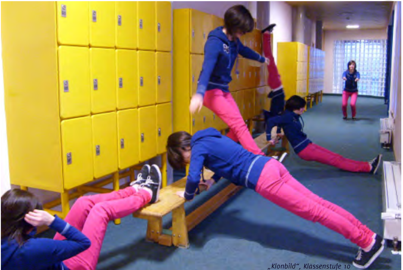
„Klonbild“, Klassenstufe 10

Informationen des Schönbuch-Gymnasiums Holzgerlingen